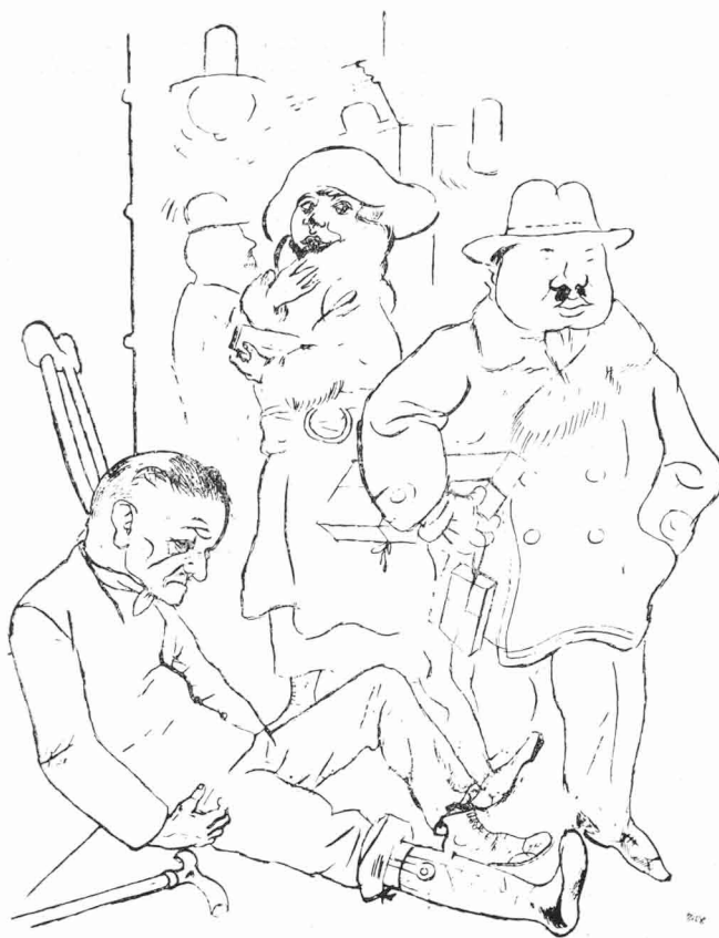
O APÓS GUERRA — DESENHO DE GOERG GROSZ