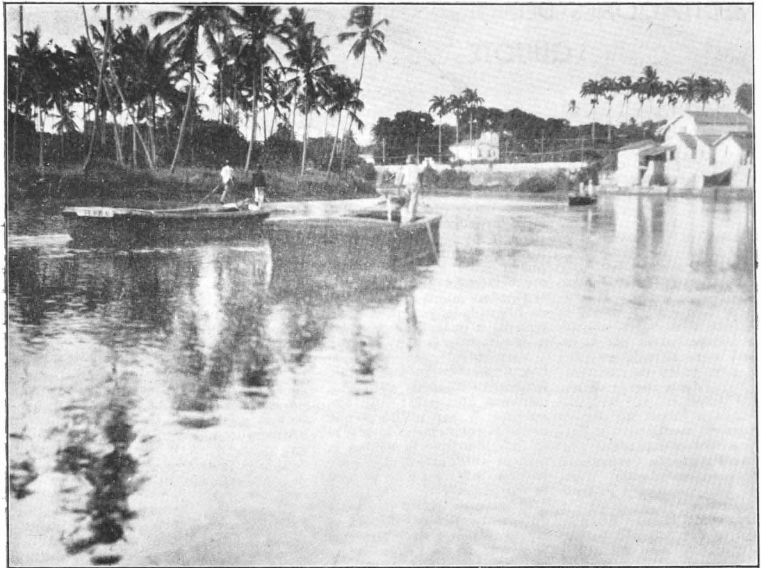
TRECHO DO RIO CAPIBARIBE