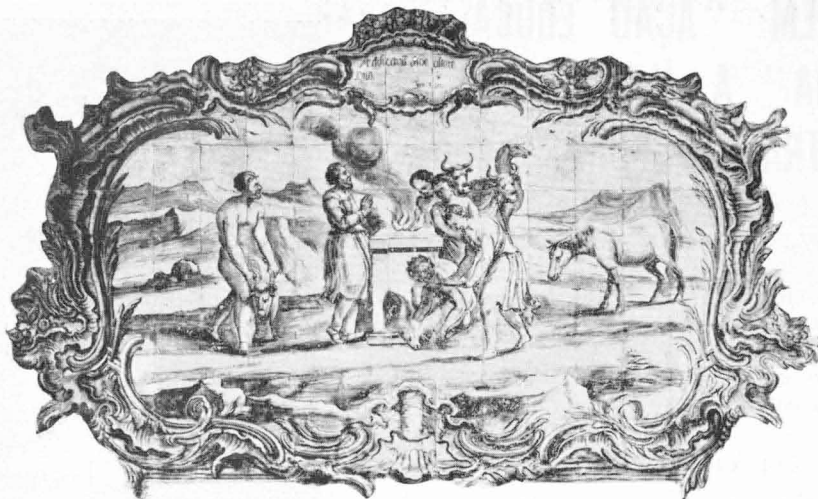
AZULEJO DO CLAUSTRO DOS FRANCISCANOS DE RECIFE