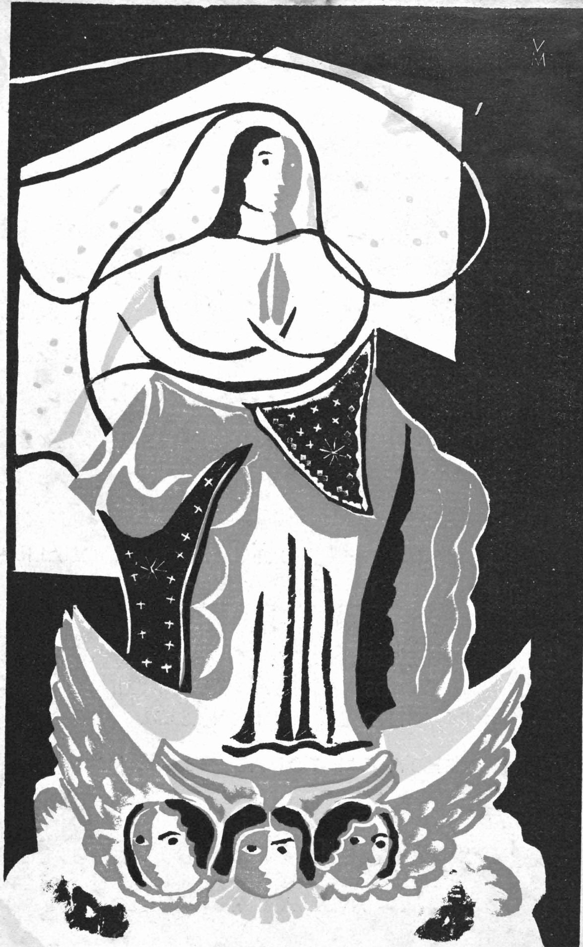
N.ª S.ª DA ASSUNÇÃO