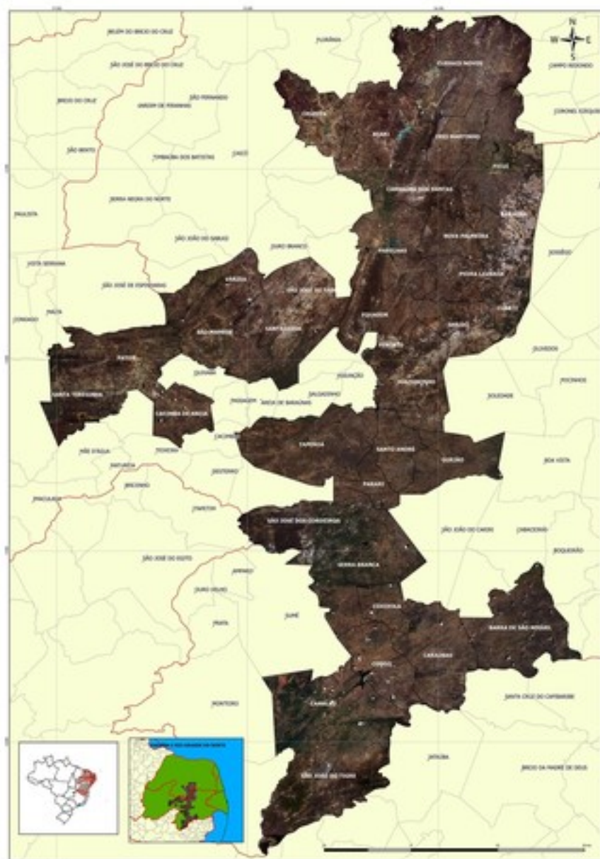
Núcleo de desertificação do Seridó é composto por municípios da Paraíba e Rio Grande do Norte

O mestre em engenharia agrícola explica que há uma alternativa para continuar usando o fogão à lenha sem desmatar a caatinga. "O correto seria que aquele produtor ou aquele agricultor que ainda utiliza fogo à lenha que ele coletasse aquelas árvores já mortas na mata e caídas, não que cortasse as árvores", recomenda.