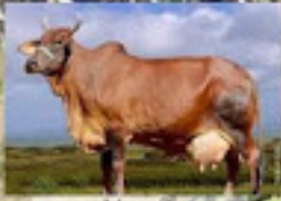
Adega O Recordista Nacional 38,7 kg leite/dia