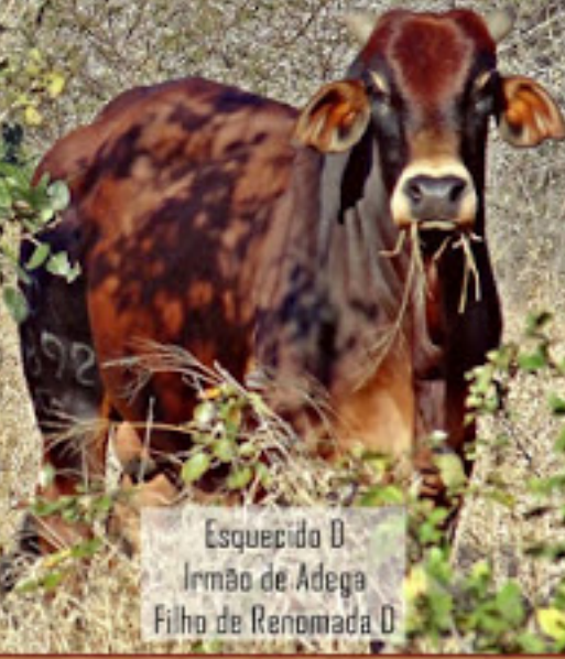
Esquecido O Irmão de Adega Filho de Renomada O